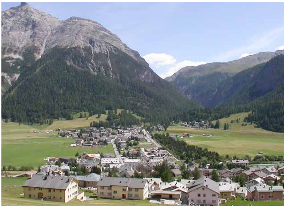
Wachsen die beiden Ortsteile La Punt (unten) und Chamues-ch bald definitiv zusammen? Überlegungen sind vorhanden, die Diskussionen laufen.