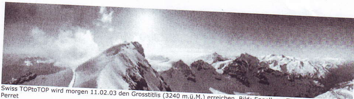
Swiss TOPToTOP wird morgen 11.02.03 den Grosstitlis (3240 m.ü.M.) erreichen. Bild: Engelberg-Titlis, Photo: Ch. Perret