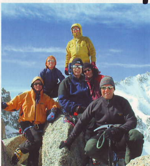
Das Top-to-Top-Team mit Freunden auf der Petite Fourche, 3512 m

Nur wer sorgfältig plant, kann in den Bergen ungetrückt campieren. Die rechtliche Situation in der Schweiz wird ganz unterschiedlich gehandhabt. Zwischbergental/VS