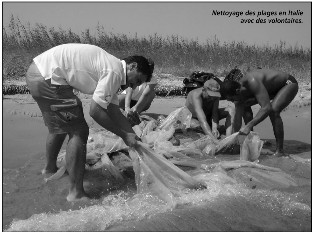
Nettoyage des plages en Italie avec des volontaires.

L'expédition "Top to Top" à suivre sur le site internet.