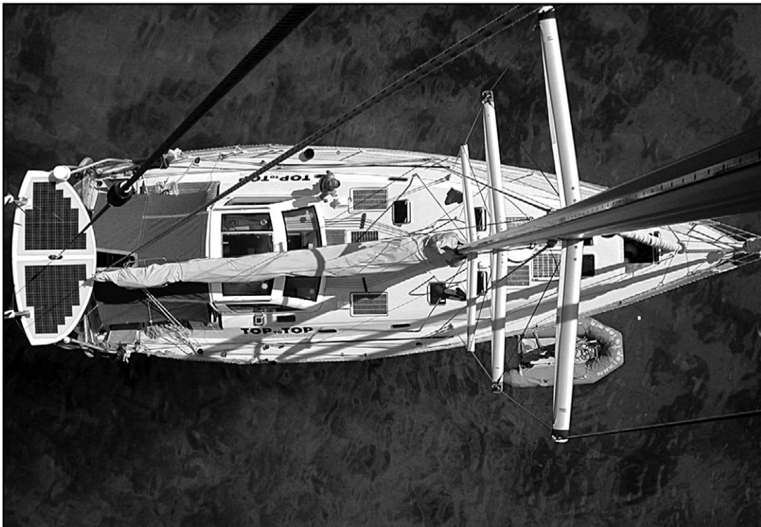
Le Top to Top fait actuellement escale à Tahiti, mais il est en carénage chez Technimarine à Fare Ute après avoir essuyé une tempête entre l'île de Pâques et la Patagonie.