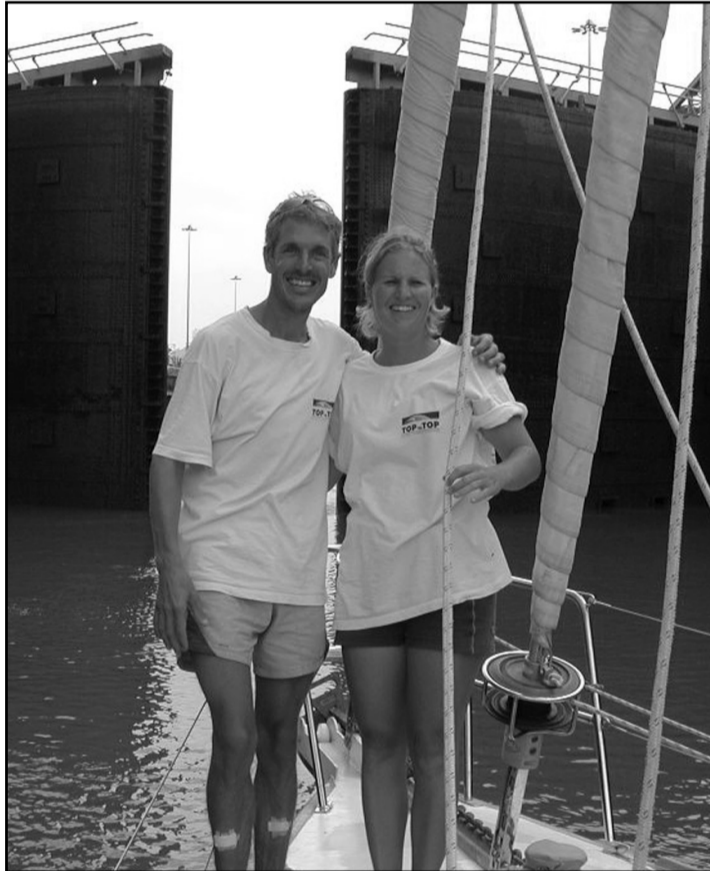
Le "Top to Top" passe le canal de Panama pour entamer sa traversée du Pacifique.

Félicitations et bon vent à ces globe-trotteurs-messagers de l'environnement qui ont entrepris une bien belle expédition. ■