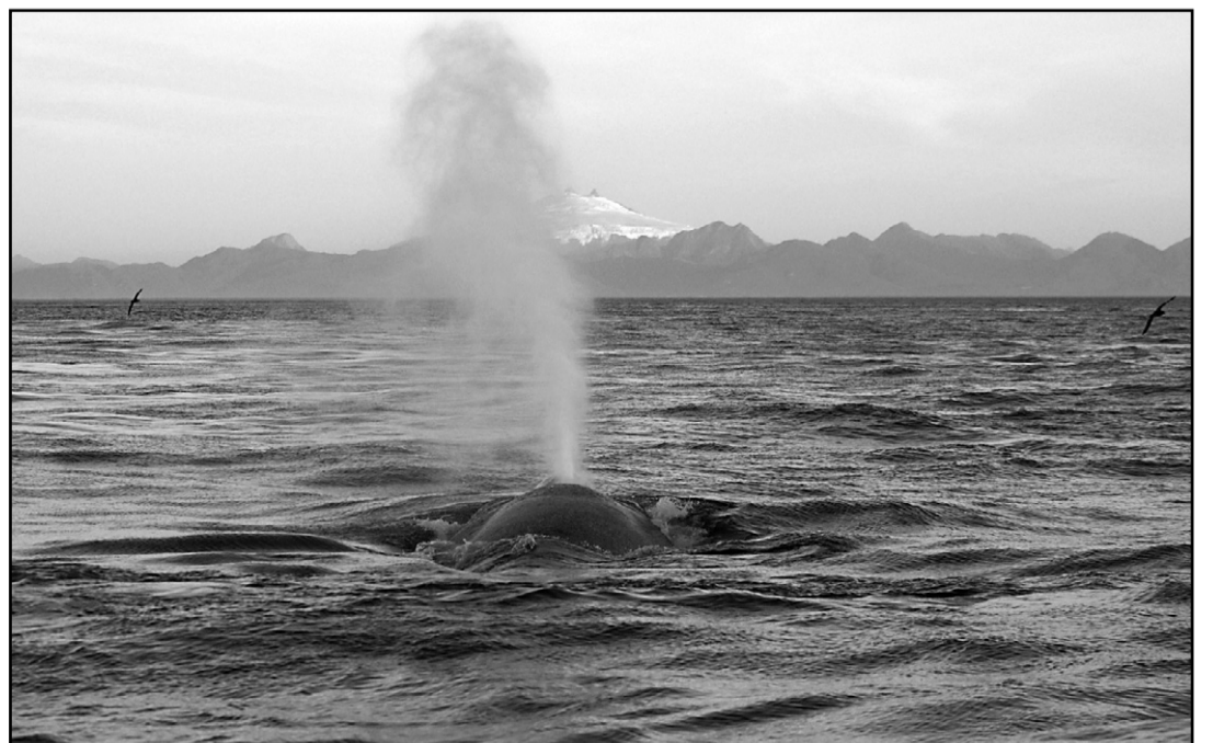
En Patagonie, merveille de la nature : une baleine suit le bateau.