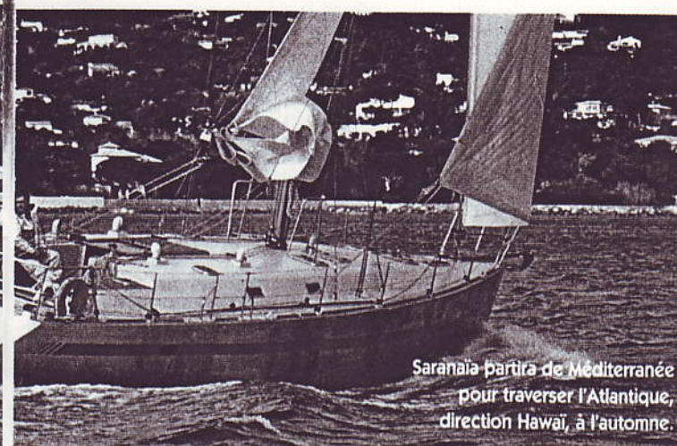
Saranaia partira de Méditerranée pour traverser l'Atlantique, direction Hawaï, à l'automne.

exhaustif : soixante-neuf étapes non-stop autour du globe et sur le plus haut sommet de chaque continent. Symboliquement, le départ sera donné cet été sur le Mont Blanc avant un premier convoi par la mer direction Hawaï qui devrait être rallié en juin 2001. L'appareillage se fera pendant le salon nautique de Cannes. Les 50 000 milles nautiques et les 130 000 mètres de dénivellé à pied amèneront les équipages tour à tour vers l'Alaska, l'Antarctique, Valparaiso, la Nouvelle-Zélande, l'Australie, l'Indonésie puis l'Himalaya, pour revenir en Europe via l'océan Indien (Seychelles, Suez). La boucle sera bouclée lorsque la flamme de TOPtoTOP sera de nouveau allumée sur le Mont Blanc. Ces quatre ans à boucliner autour du monde marin et alpin