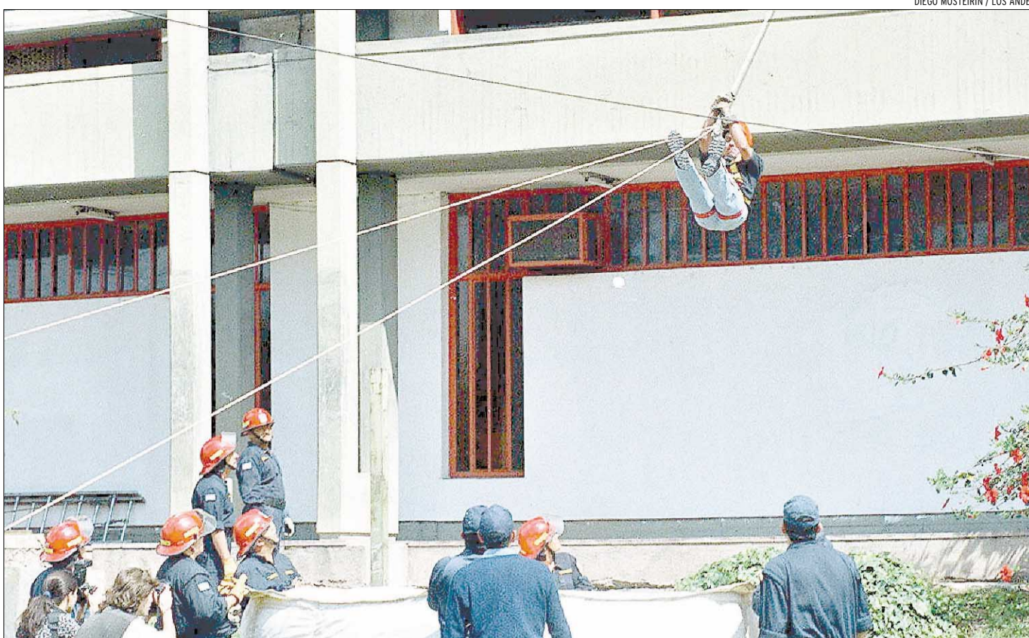
EN ACCIÓN. Uno de los bomberos se desliza desde el primer piso del Magisterio.

El simulacro duró poco más de media hora, tiempo bastante extenso, según algunos estudiantes. "La evacuación del colegio fue muy rápida, pero la asistencia fue muy lenta, y yo que era uno de los supuestos heridos, estaba atrapado en el pri-